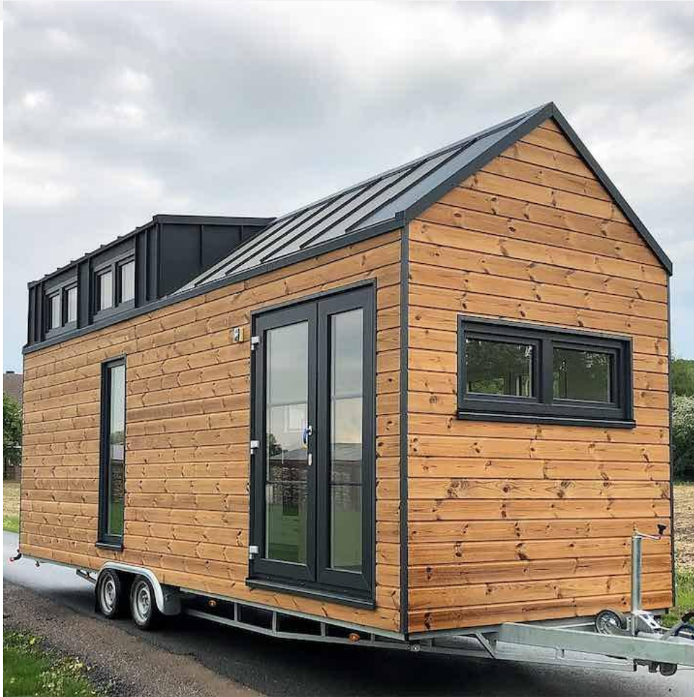
Bild: Tiny House auf Rädern